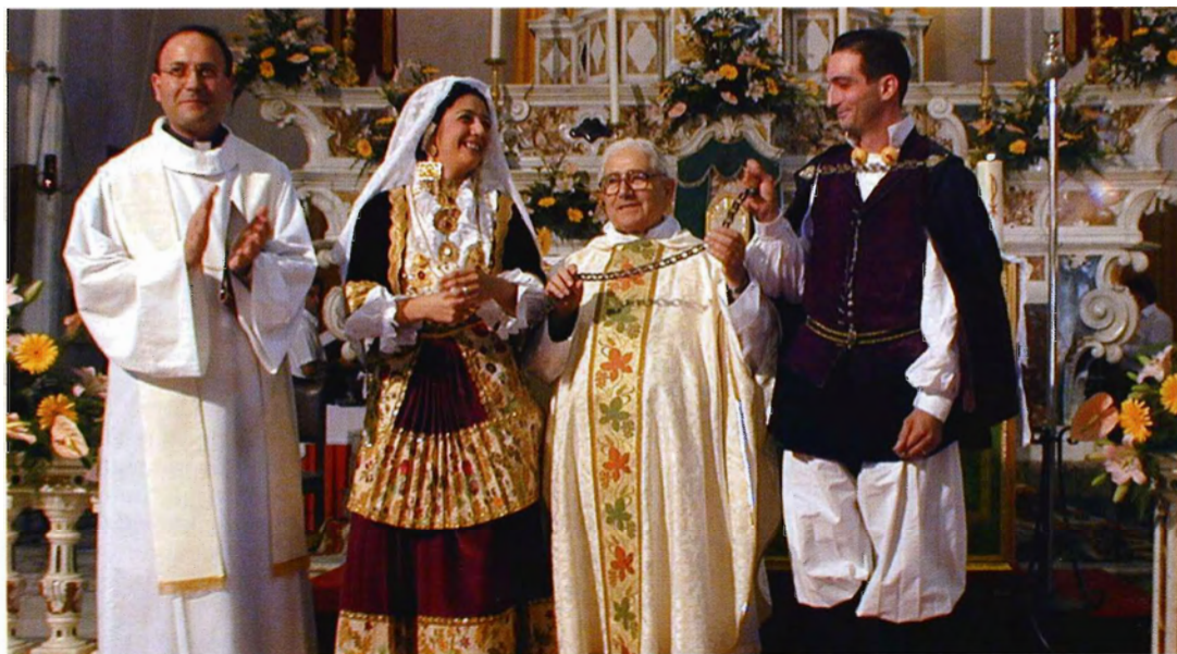
Secondo il Concilio Plenario Sardo, si può parlare con verità di "popolo sardo".

Un intero capitolo è dedicato alla "pietà popolare" che "custodisce un suo millenario patrimonio di tradizioni cristiane armonizzando, secondo un proprio timbro inconfondibile, apporti provenienti nei secoli dal Nord-Africa e dall'Oriente bizantino, dalla penisola italiana e iberica". Riti e feste comunitarie,