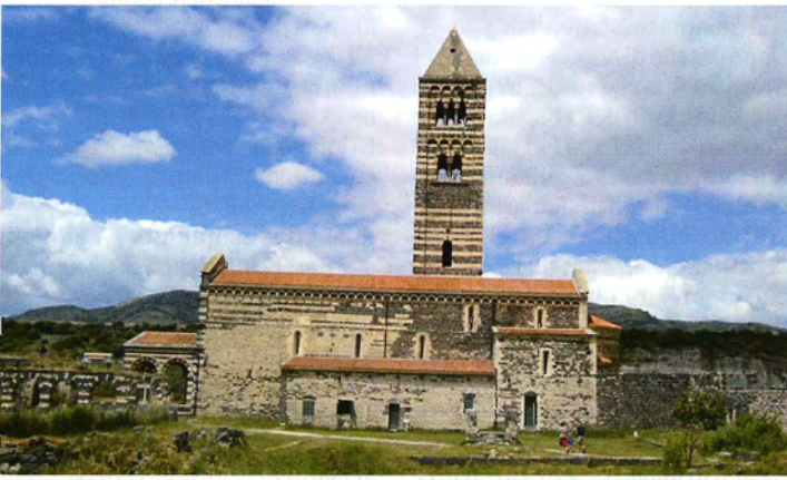
Una bella immagine della Basilica di Saccargia.