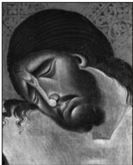
Particolare del Crocifisso di Cimabue

Il crocifisso è simbolo dell'amore e della fratellanza universale e non di un ottuso orgoglio nazionalista. Fare del crocifisso lo stesso uso che si farebbe di un manifesto o di una bandiera, esponendolo in luoghi pubblici e non sacri, è un'offesa all'ideale cristiano che è un messaggio universale. Lo Stato non ha il diritto quindi di "appropriarsi" del crocifisso, di usarlo come una bandiera o di farsi rappresentare da un Dio.