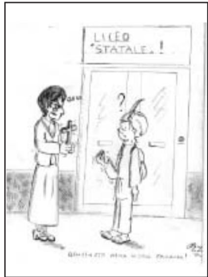
Olimpia Loddo V-B