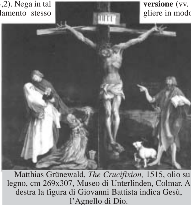
Matthias Grünewald, The Crucifixion , 1515, olio su legno, cm 269x307, Museo di Unterlinden, Colmar. A destra la figura di Giovanni Battista indica Gesù, l'Agnello di Dio.

La memoria della tua venuta nella nostra debolezza, ci insegna, Signore, ad andare verso di te, a traversare i nostri deserti di distrazione e scoraggiamento, nella forza del tuo Spirito, per vedere con te il volto del Padre. (Antonio Pinna)